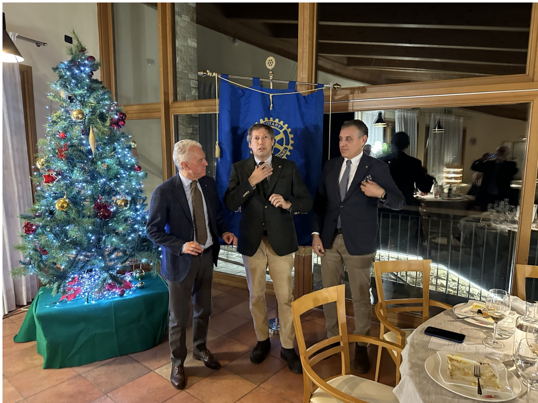
Buon lavoro a tutti!