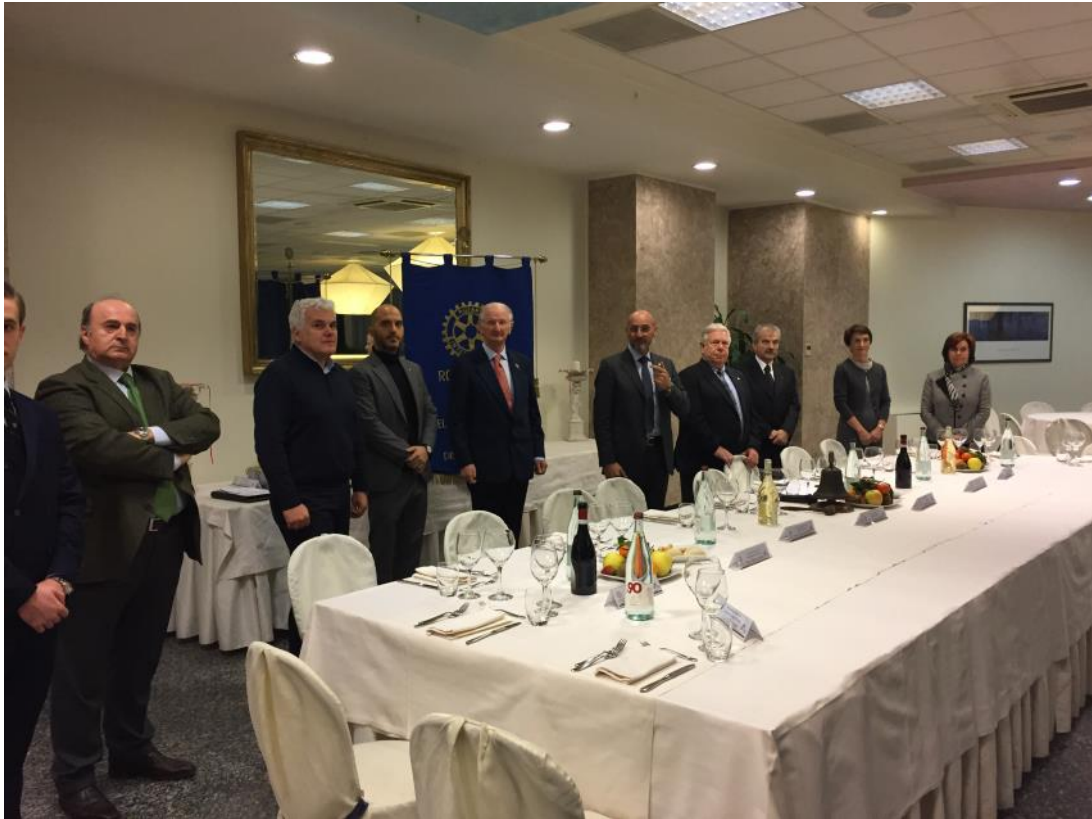
Il saluto alle bandiere.