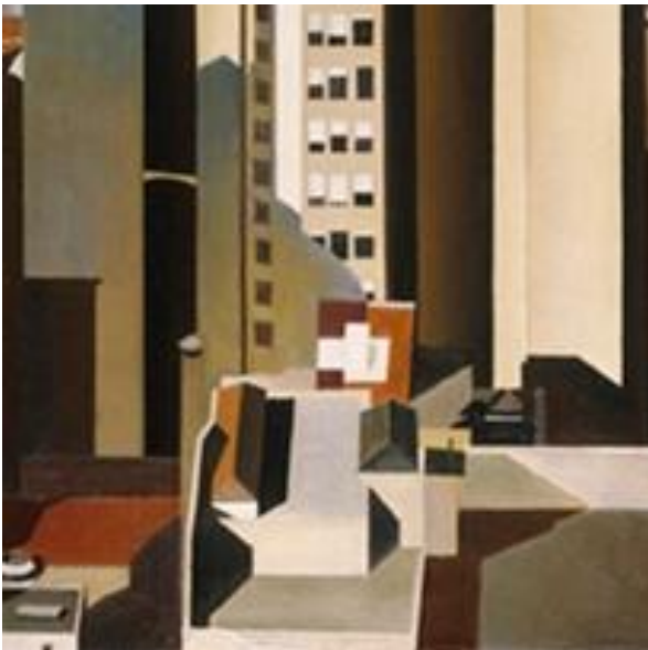
Charles Sheeler - "Skyscrapers" (dettaglio), 1922. Olio su tela

Il confronto è dunque l'occasione per un'inedita e documentata verifica sulle diversità culturali che hanno caratterizzato l'Italia e gli Stati Uniti e di una riflessione sui risultati che, dopo la seconda guerra mondiale, hanno assegnato alla tradizione artistica americana un ruolo di riferimento incontrastato per tutta l'arte mondiale. In mostra sono presenti oltre cento opere con capolavori di artisti quali John Sloan, Arthur Dove, Jackson Pollock, Robert Motherwell, Clyfford Still, Mark Rothko.