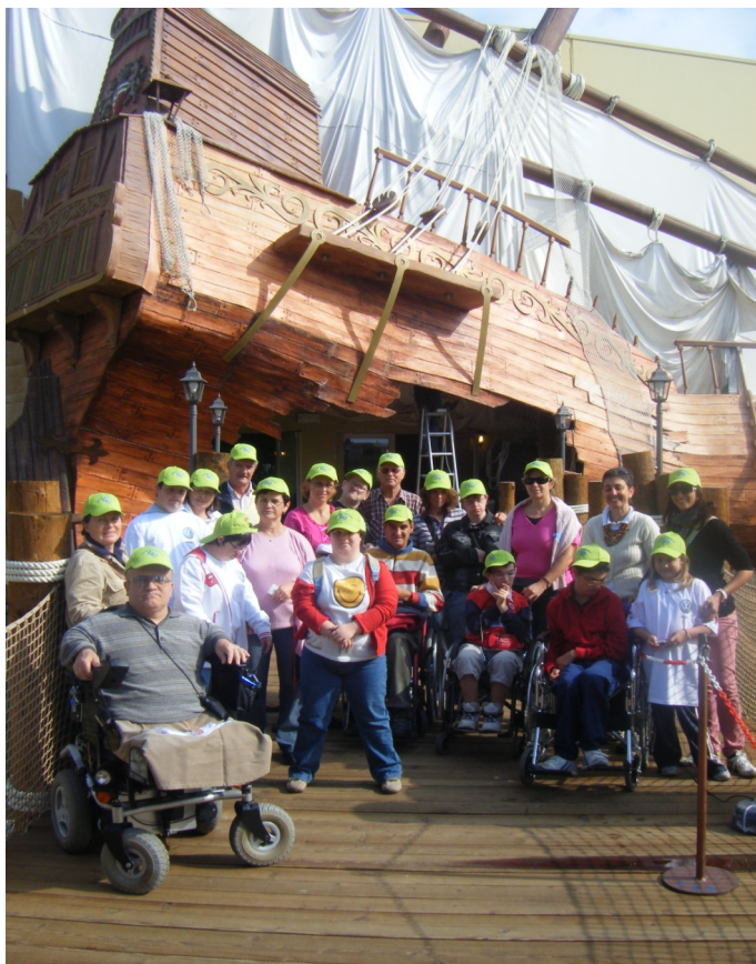
Alcuni nostri ragazzi ed accompagnatori davanti al galeone

“Siamo noi a dover ringraziare voi per averci dato la possibilità di vivere un' esperienza bellissima, che lascerà un segno indelebile nei nostri cuori. Vedere il sorriso sul viso dei ragazzi, la loro voglia di vivere, l' affetto che sanno regalare è una sensa-