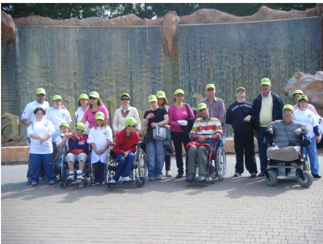
Un gruppo al parco

Alla terza edizione di "Sorriso a Gardaland", importante manifestazione organizzata da tutti i Rotary di Verona e provincia che porta all'importante Parco di attrazioni numerosi disabili, il nostro Club è passato dal ruolo di sponsor a quello di protagonista con la presenza di tre suoi ospiti.