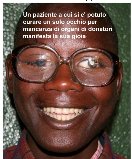
Un paziente a cui si e' potuto curare un solo occhio per mancanza di organi di donatori manifesta la sua gioia

medicinali, di equipaggiamenti appropriati e di organi disponibili per il trapianto spesso impediscono gli interventi. In alcuni casi questo non permette una cura completa ma si deve limitare a soluzioni prammatiche. Per esempio nei casi di trapianti ai ciechi la mancanza di organi limita l'intervento ad un solo occhio. E' commovente vedere la felicita' dei malati dopo la loro guarigione che aspettano a volte da anni. Suscita