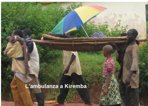
L'ambulanza a Kiremba

illustrato l'ambiente in cui lavoreranno i volontari e mostrato alcune fotografie di interventi avvenuti con successo. Purtroppo si deve segnalare che non tutti i pazienti possono sempre essere operati; la mancanza di