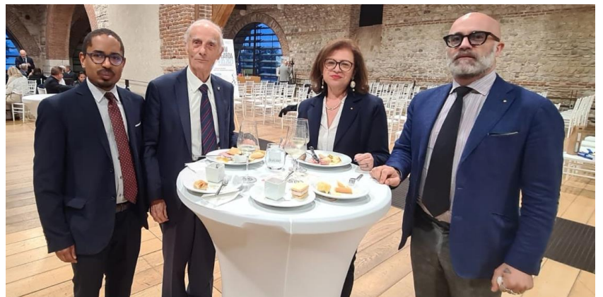
I nuovi arrivi e il senior del Club