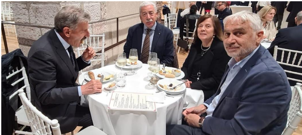
Il co-segretario pro tempore con il fotografo provetto