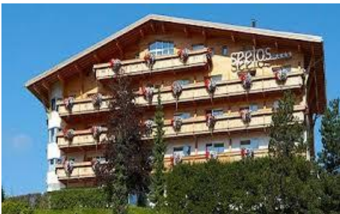
Hotel Seelos ★★★★★

Le temperature a Reutte-Füssen sono mediamente inferiori di una decina di gradi rispetto al lago. Un impermeabile è consigliato perché le probabilità di brutto tempo nel periodo sono del 60%; sabato sera saliremo a 1600 mt. di quota, consigliato una giacca pesante. Non ci sono serate formali per cui abbigliamento libero.