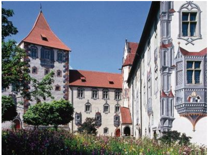
Castello di Füssen

Jakob Hiebeler (1602): in quest'opera, la più antica del suo genere in tutta la Baviera, la Morte trascina con sé ricchi e poveri, persone di tutti i ceti, ammonendo che nessuno può sottrarsi alla danza dell'ultima ora. Nel XV e XVI secolo Füssen si distinse anche per la sua ricchezza temporale. Come deposito per le merci di passaggio tra l'Italia ed Augsburg , la città visse un periodo di grande fioritura economica, che si rispecchia ancor oggi nel suo ben conservato centro storico. Anche la fortezza del XIV secolo venne trasformata in castello nel 1500: nacque così uno dei complessi architettonici tardogotici più significativi della Germania, con una corte pittoresca e splendidi affreschi trompe-l'oeil sulle facciate.