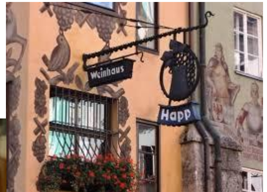
Restaurant Weinhaus Happ.

A metà percorsa sosta obbligatoria autista.