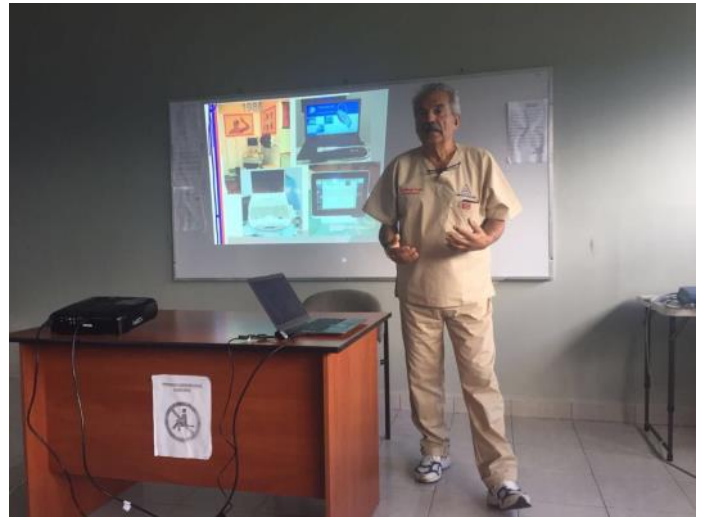
Ore 7,30 lezione a 75 studenti universitari di medicina.