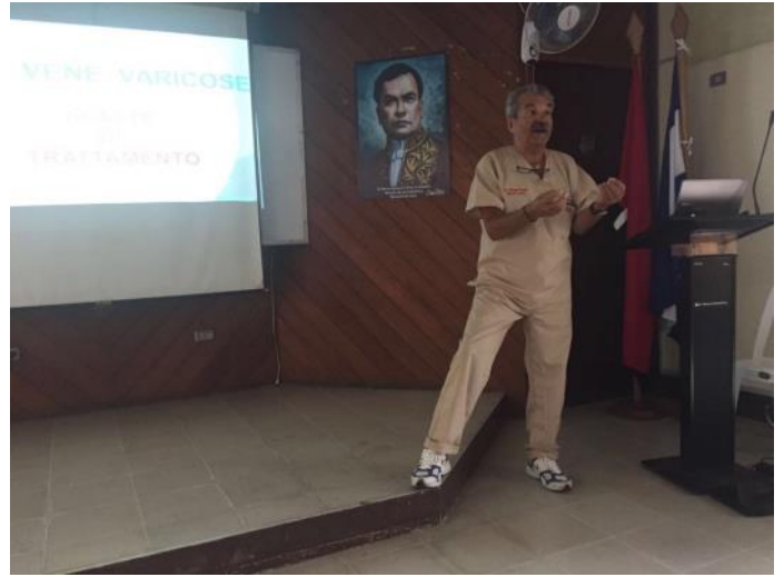
Corso formativo all'ospedale di Matagalpa