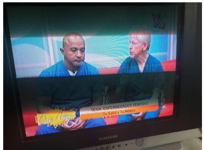
Incontro con il rappresentante locale del rotary ed intervista televisiva