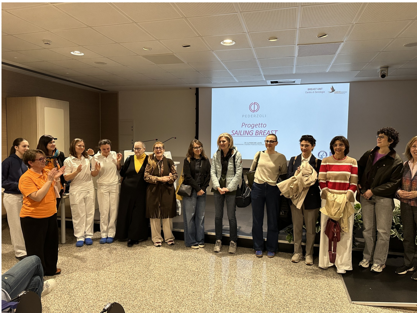
Alcune delle signore che partecipano all'iniziativa