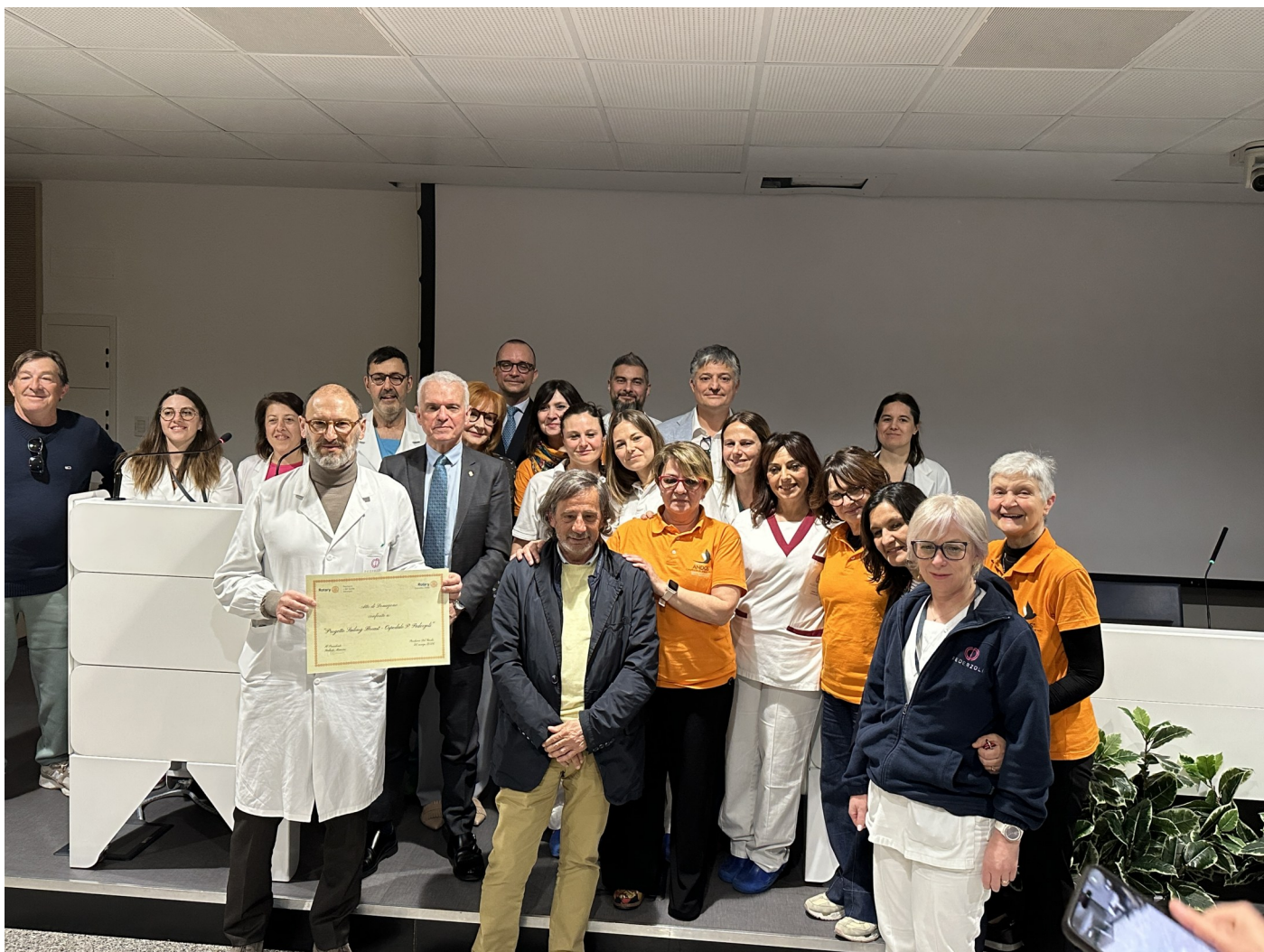
Foto di tutti gli operatori