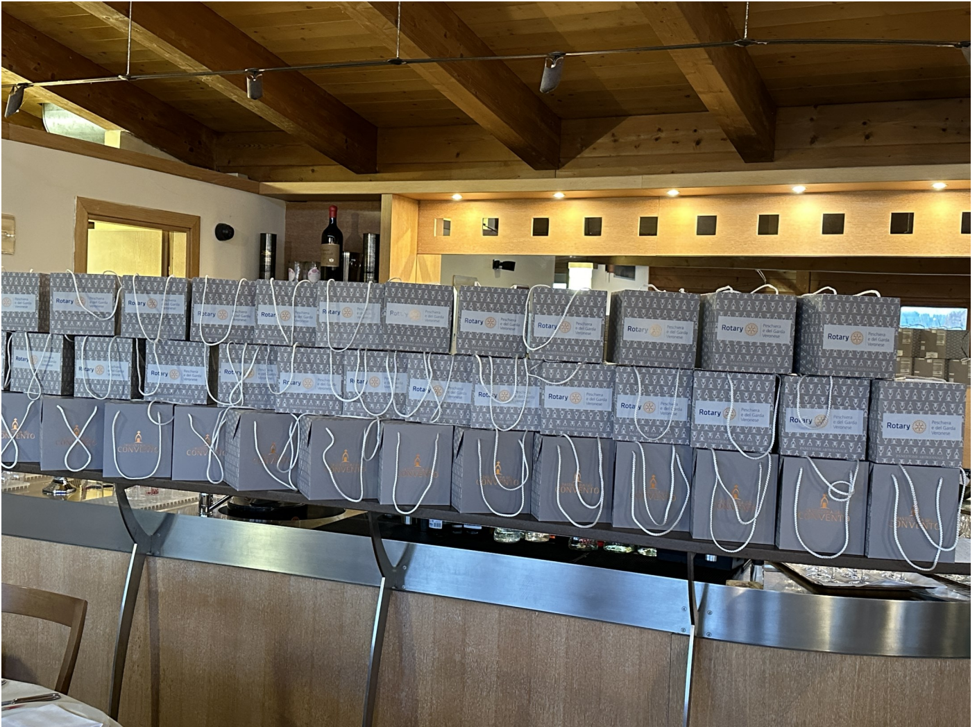
I panettoni artigianali per il service borse di studio