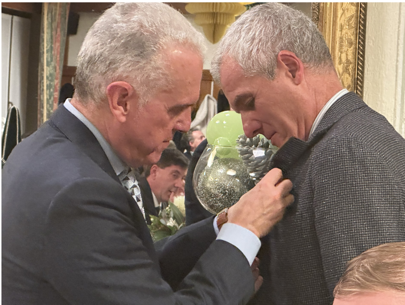
Il Presidente spilla il nuovo socio.