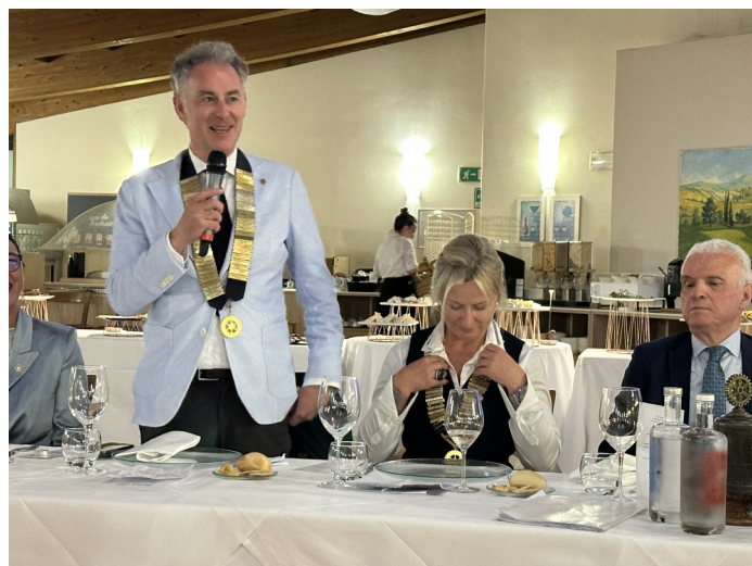
Il saluto dei Presidenti